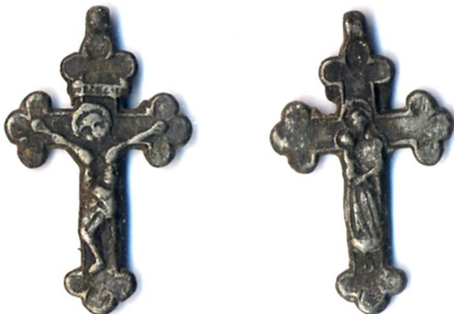
Lisa 3. Metallristid.

https://www.caminoteca.com/en/content/23-symbols-of-the-camino