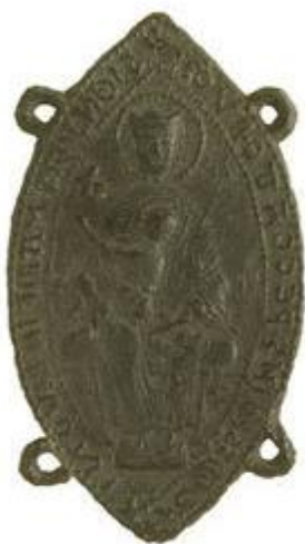
Lisa 6. Maarjamaa palverändurimärk.

https://www.numisantica.com/index.php?item=medieval-pewter-pilgrim-badge-aachen-mirror-badge_%20&action=article&aid=6947&lang=en#.WjlcCVVI-M8