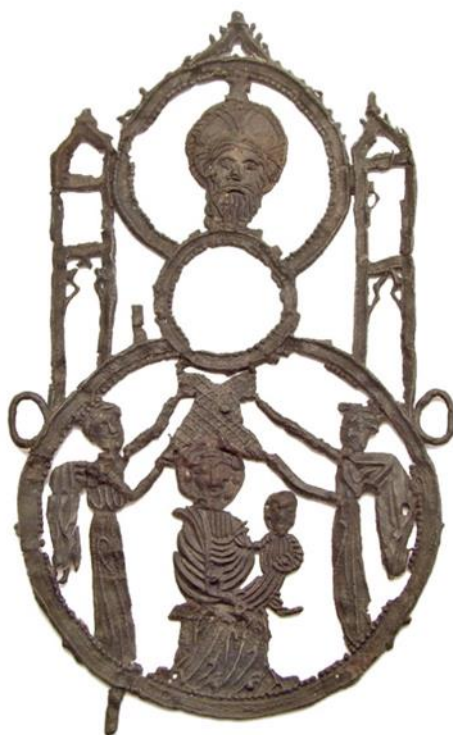
Lisa 5. Võremärgid.

https://www.numisantica.com/index.php?item=medieval-pewter-pilgrim-badge-aachen-mirror-badge_%20&action=article&aid=6947&lang=en#.WjlcCVVI-M8